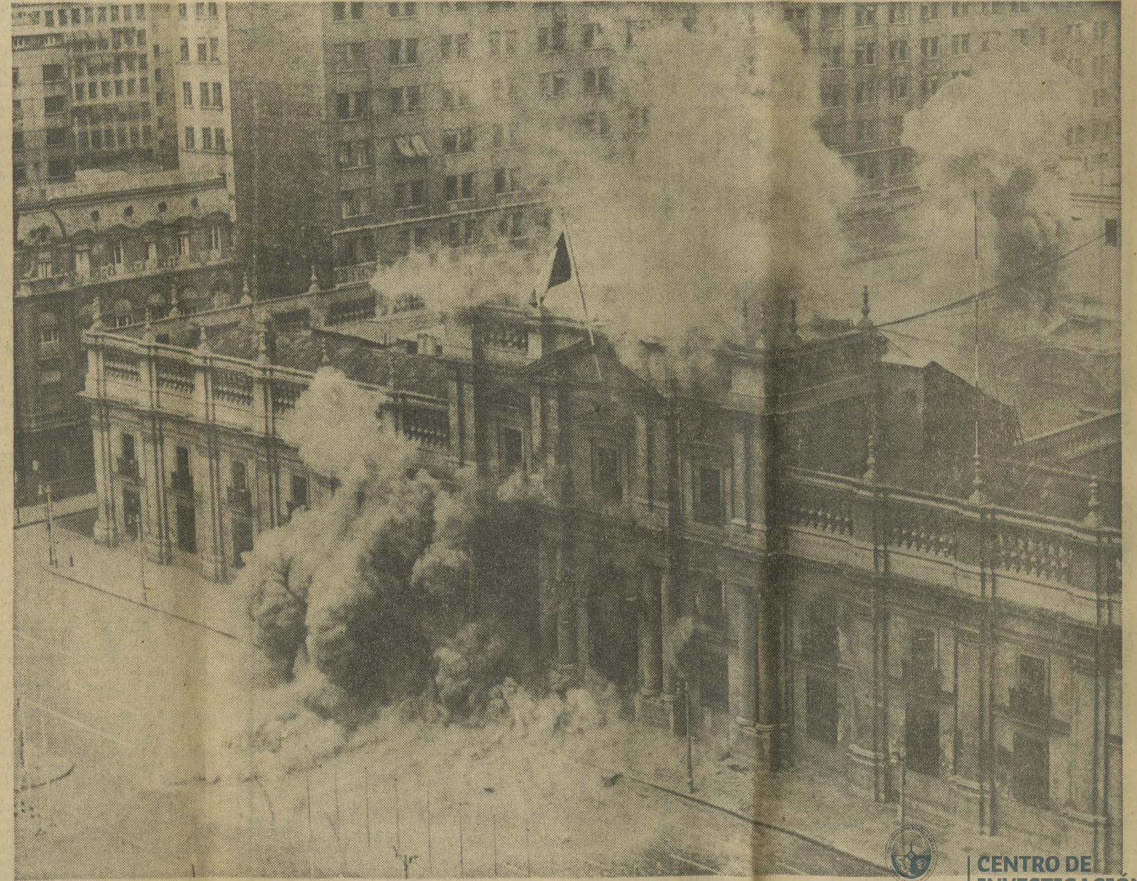
Esta espectacular fotografía, captada desde el decimotercer piso del Hotel Carrera, muestra el instante en que uno de los aviones a reacción de la FACH deja caer tres "rockets" vocando una violenta explosión y humareda

te disolver las formaciones paramilitares constituidas alrededor del Gobierno en forma paralela