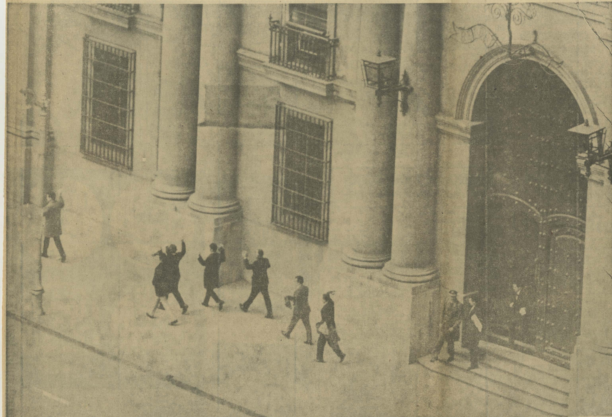
Con pañuelos blancos y las manos en alto abandonan el Palacio de Gobierno minutos antes de iniciarse el ataque algunos funcionarios del ex régimen de la Unidad Popular