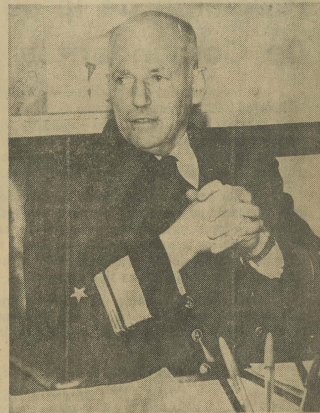
Ministro de Relaciones Exteriores, contralmirante Ismael Huerta

Ante el rompimiento de la unidad nacional y la incapacidad de mantener la convivencia entre los chilenos, ese Gobierno se colocó al margen de la constitucionalidad, además de comprometer seriamente la seguridad del país. Las Fuerzas Armadas no podían permanecer indiferentes ante el clamor de la inmensa mayoría del país. De-