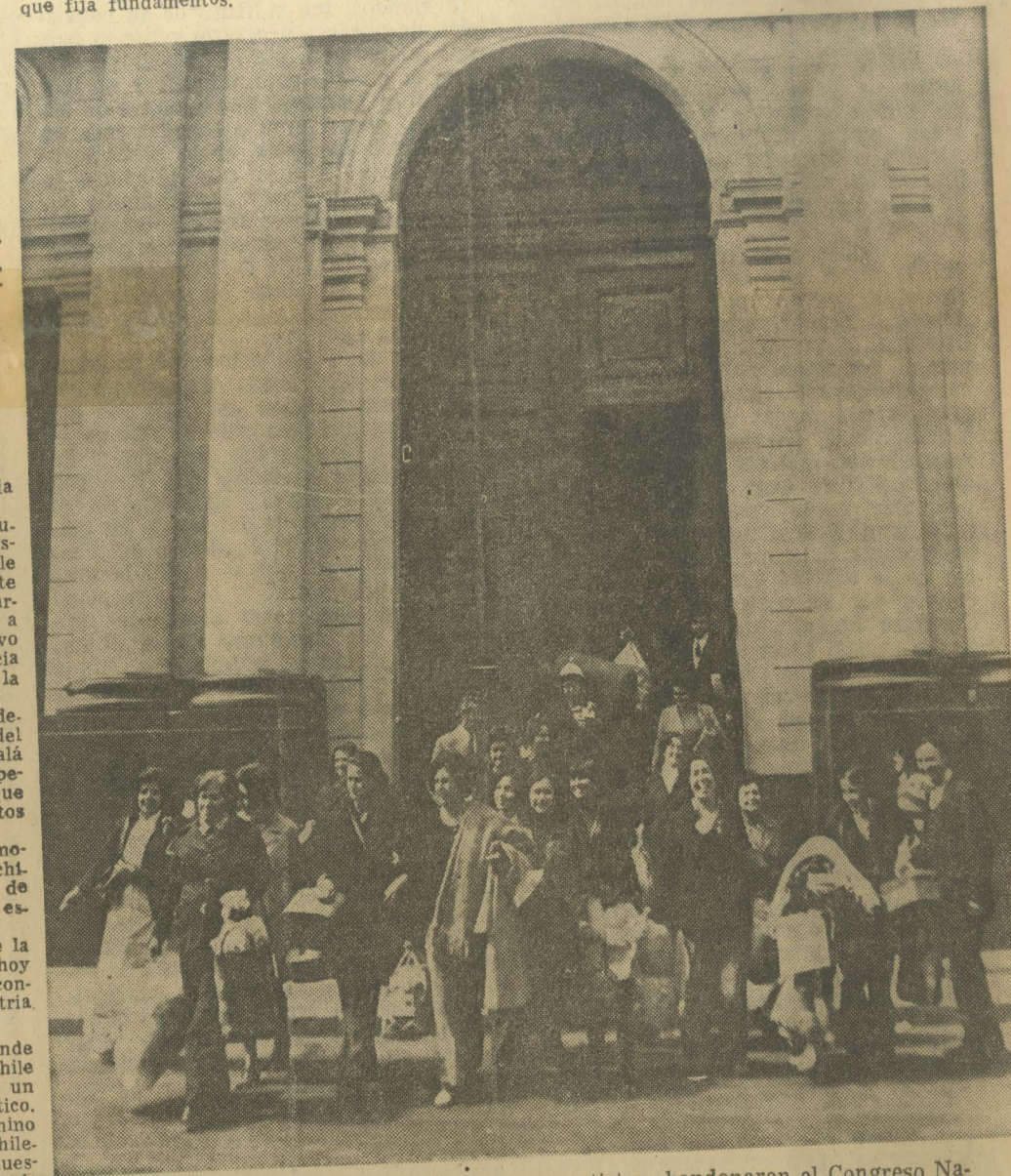
A las 9 horas de ayer las mujeres de transportistas abandonaron el Congreso Nacional, donde permanecieron durante varias semanas, en señal de protesta por la negativa del gobierno marxista de solucionar el conflicto que afectaba a los camioneros

Por eso, el Poder Femenino llama a todas las mujeres chilenas a que, una vez más, demuestren su inagotable espíritu de sacrificio y a colaborar con las Fuerzas Armadas para que Chile permanezca libre, solidario, progresista y pleno dueño de su destino".