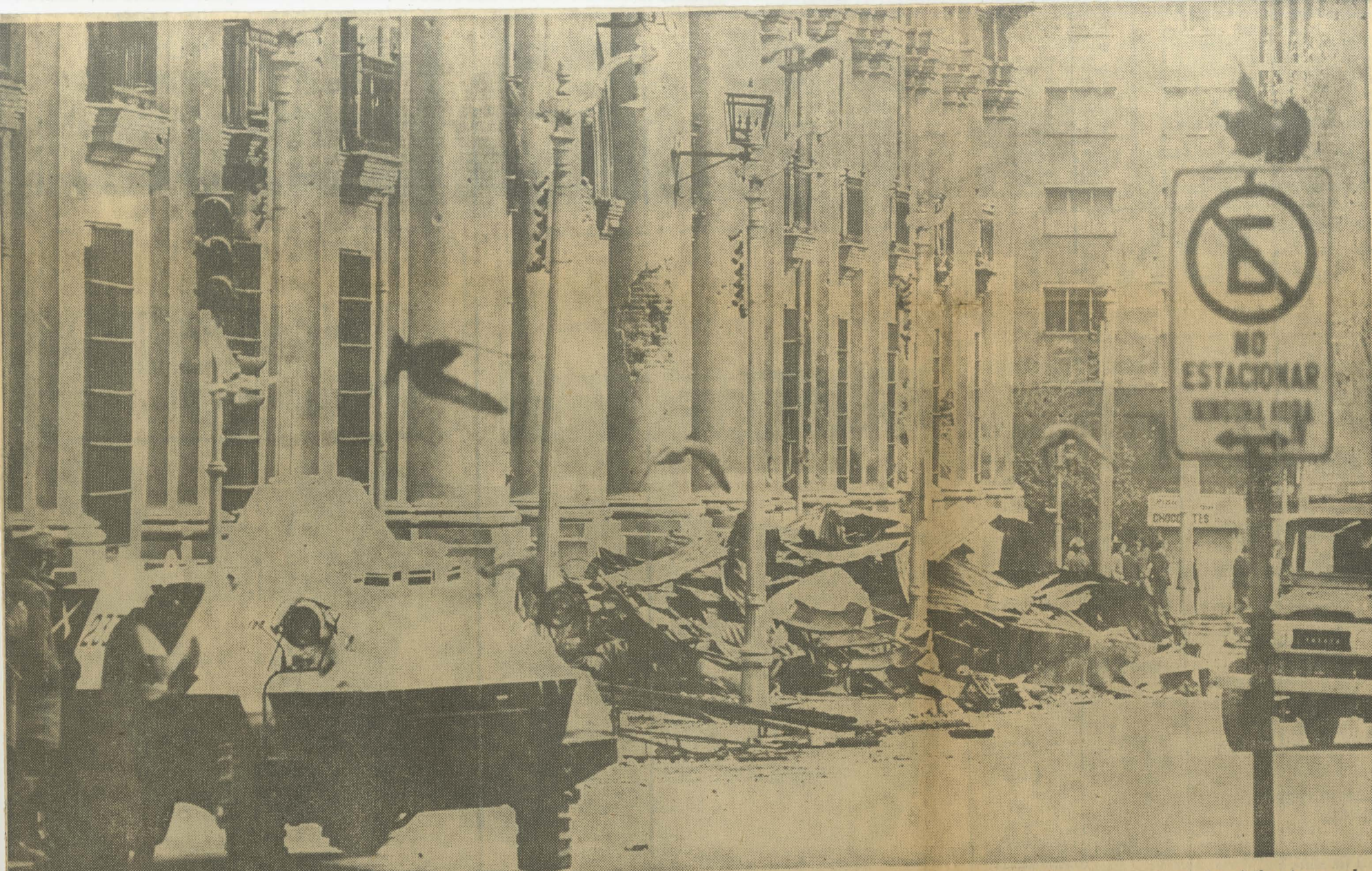
En el frontis de La Moneda se pueden apreciar los efectos de las armas de grueso calibre. Los desechos que se advierten fueron sacados por los bomberos una vez dominado el incendio, provocado por el bombardeo. Una tanqueta de Carabineros refuerza la vigilancia en el sector