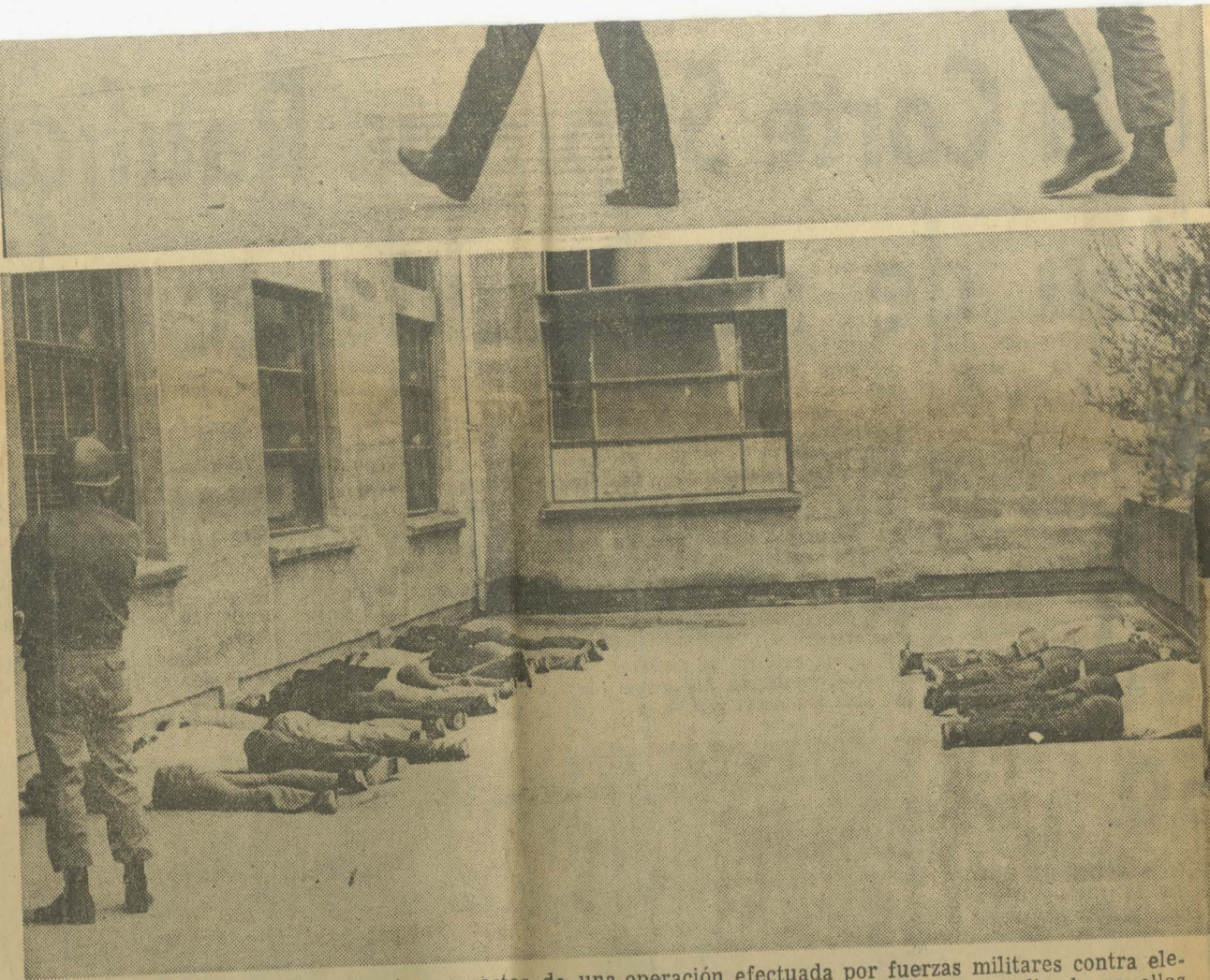
La secuencia gráfica muestra tres aspectos de una operación efectuada por fuerzas militares contra elementos extremistas y francotiradores. Arriba, los soldados allanan dos vehículos, sorprendiendo en ellos numerosas armas que aparecen envueltas en el bulto que está en el suelo. Al medio, uno de estos individuos es llevado manos en alto al interior de la Escuela Militar, y finalmente, abajo, aparecen boca abajo numerosos elementos ultras, que han sido allanados, en los patios de la Escuela Militar

FOCO EXTREMISTA ARMADO RESISTIO A TIROS LA RENDICION.—